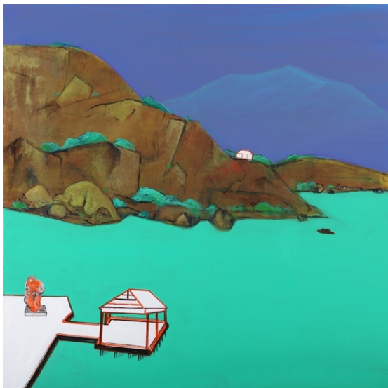
鄭在東 (b. 1953) 《階前群壑深》2022 布面 丙烯 200 x 200 cm

結合畫廊三月的展覽，漢雅軒在「巴塞爾藝術展」特別介紹廣州年輕藝術家集體「菠蘿核」和「閱覽室」合作的一幅 7 米的「屏風繪畫」。這件屏風剛剛參展「十五屆卡塞爾文獻展」。「菠蘿核」成員在珠江三角洲長大，從小浸淫港台電視劇，作為瞭解世界、想象未來的窗口。「菠蘿核」的創作反映了 2000 以來新一代珠三角青年的世界觀，具體呈現了粵港兩地大眾文化互動的經驗和成果。