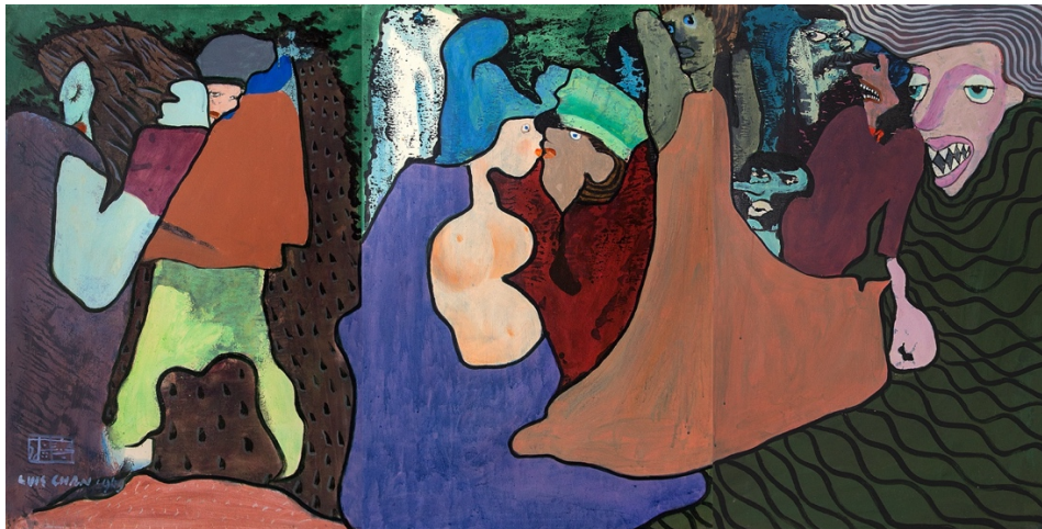
陳福善 Luis Chan (1905-1995) Untitled (Man with Saw-teeth) 《無題》(鋸齒男人) 1969 Acrylic on Paper 76 x 153 cm