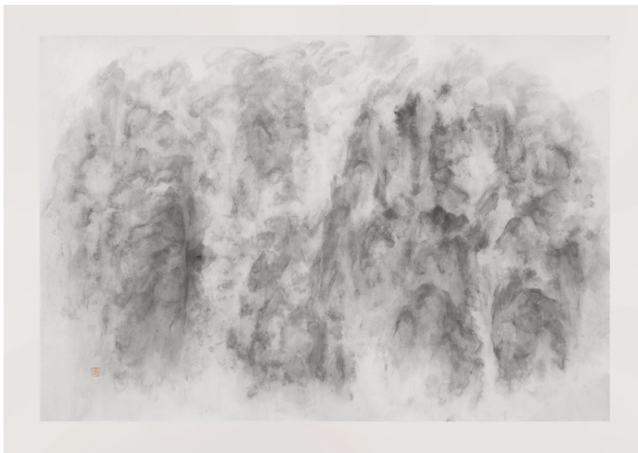
XU Longsen 徐龍森 (b. 1956) Cosmos of the Mountains No.4 《大化綢繆之四》 2017 Ink and on Paper 124 x 183 cm