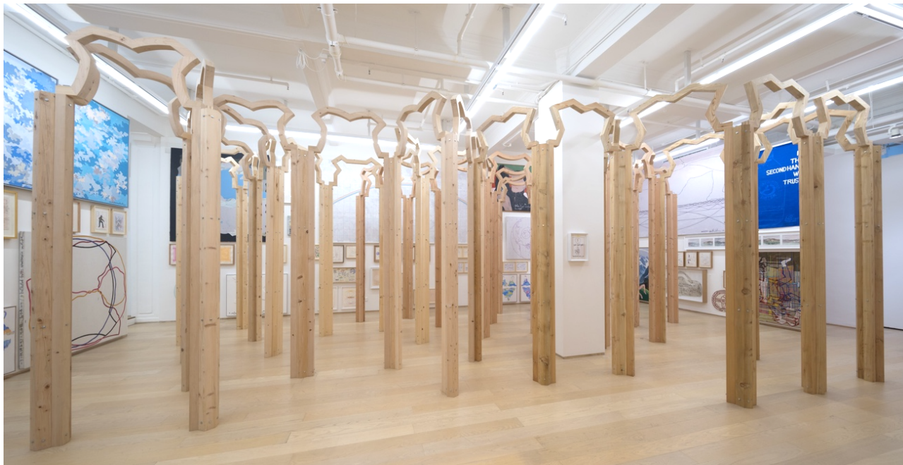
吳山專 與 英格·斯瓦拉·托斯朵蒂爾 《拱林》 2018 美洲松、鐵杉、白松、落葉松 約 330 x 900 x 500 cm

《拱林》是吳山專與英格以「小肥姘」的輪廓發展出來的拱門結構，以四種木質配上四個不同造型的拱門，分別命名為：「完美括」、「大括」、「中括」和「小括」。四座拱門排列出星宿陣型，築起一個穹空，邀請觀者在當中揣摩藝術創作的任務：創造世界。