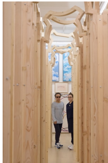
吳山專 與 英格·斯瓦拉·托斯朵蒂爾 《拱林》2018 美洲松、鐵杉、白松、落葉松 約 330 x 900 x 500 cm