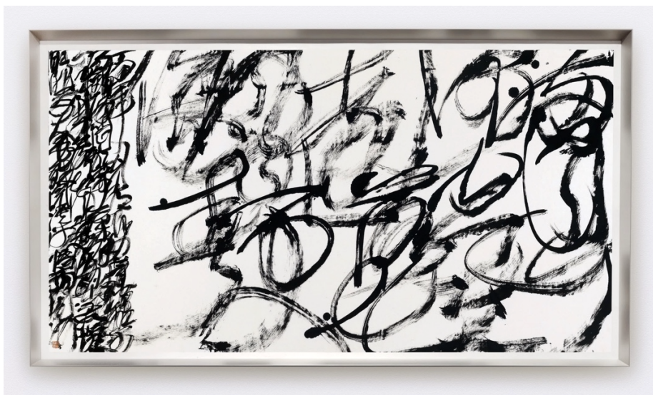
Wang Dongling 王冬齡 (b.1945) YAN Shu, 'Sandy Creek Washers', Entangled Script 《晏殊「浣溪沙」亂書》 2016 Ink on Paper 96 x 178 cm