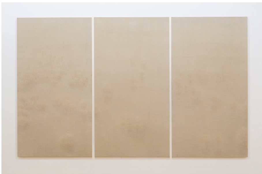
Qiu Shihua 邱世華 (b. 1940) Landscape 1999.4 Oil on Canvas 布面 油畫 1999 242 x 388.5 cm (Triptych)