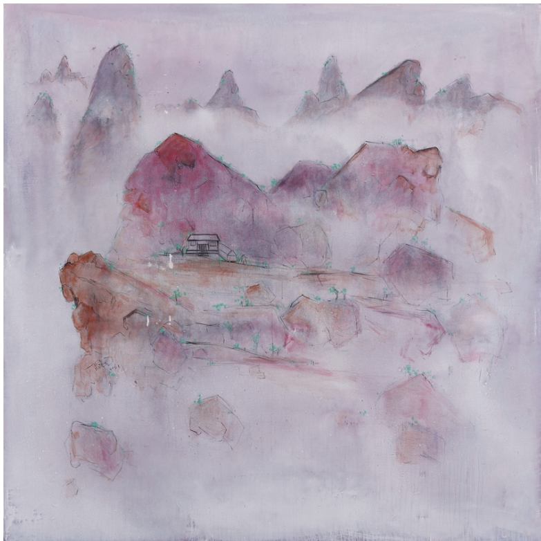
CHENG TSAI-TUNG 鄭在東 (b. 1953) A Private Studio 《小窗幽記》 2021 Acrylic on Canvas 布面 丙烯 200 x 200 cm