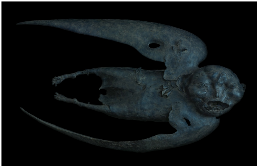
Dashi NAMDAKOV 達西·那姆達科夫(b. 1967) Levitation 《升天》 Edn. 3/8 2011 Bronze, Cast and Patinated 85 x 153 x 38 cm Edition of 8 + 4AP

達西·那姆達科夫 (b. 1967, Ukurik village, Chita region)