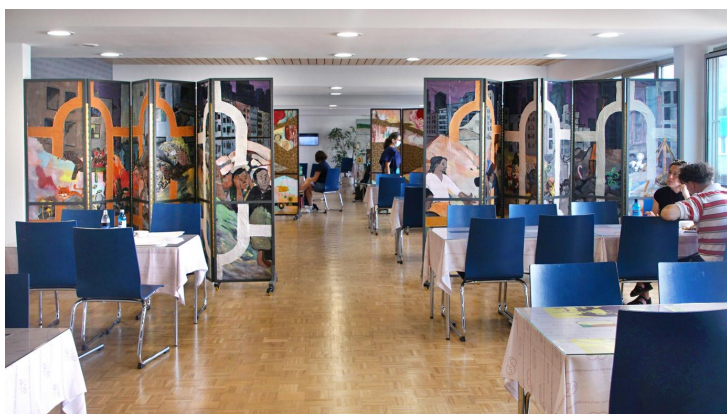
BOLOHO at Documenta fifteen, Kassel, Germany, 2022 菠蘿核於德國第十五屆卡塞爾文獻展

BOLOHOPE No.3 《BOLOHOPE 之三》2022 Acrylic and textile on canvas 集體繪畫與縫紉, 布面塑膠彩與織物 200 × 700 cm