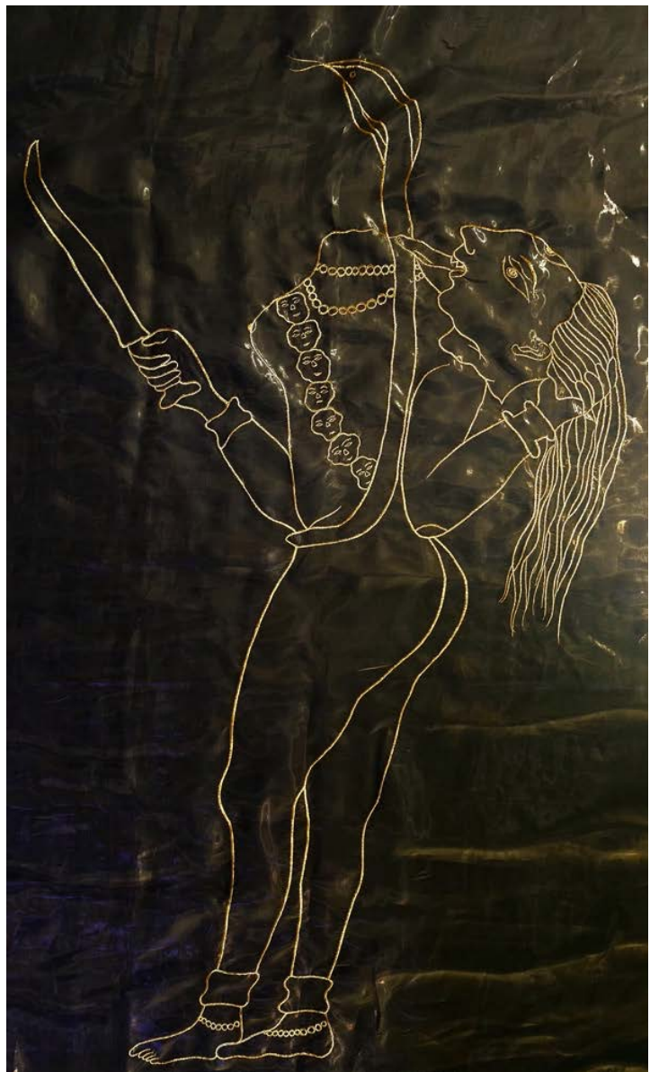
Raqs 媒體小組 《奇美拉合唱》 2025 刺繡、歐根紗、天鵝絨 183 x 112 cm 獨版 + 1AP

生滅，滅生。想要變成人類的各方神聖，和那些想要變成神靈的人類最終都將要現形。來自遠古和未來的神聖都在召喚著他們，Raqs 作為傳話的媒介，在此投入「浪跡生涯」。